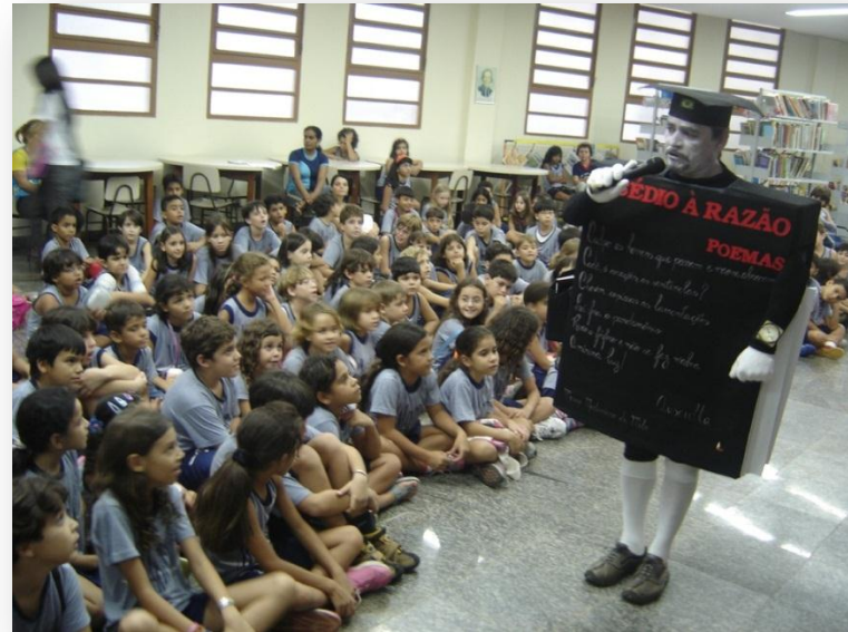
Colégio Marista de Palmas