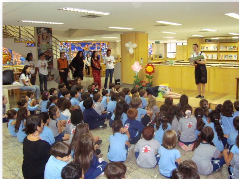
Colégio Marista Belo Horizonte