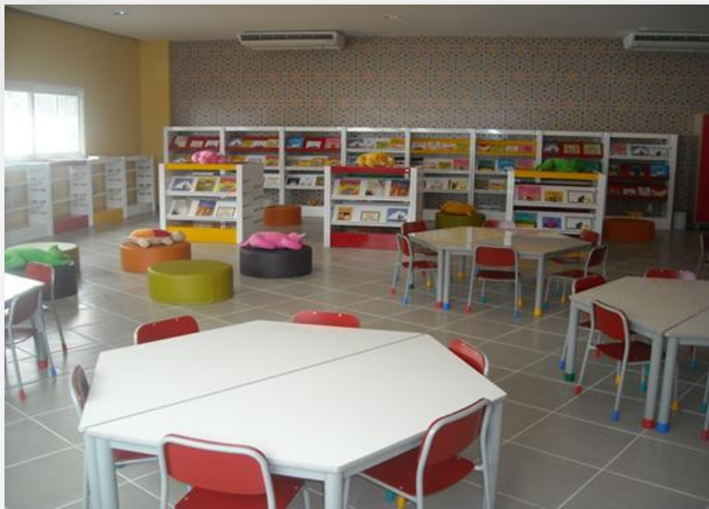
Colégio Marista Rio de Janeiro