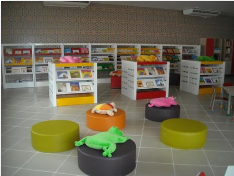
Colégio Marista Rio de Janeiro - Southeast