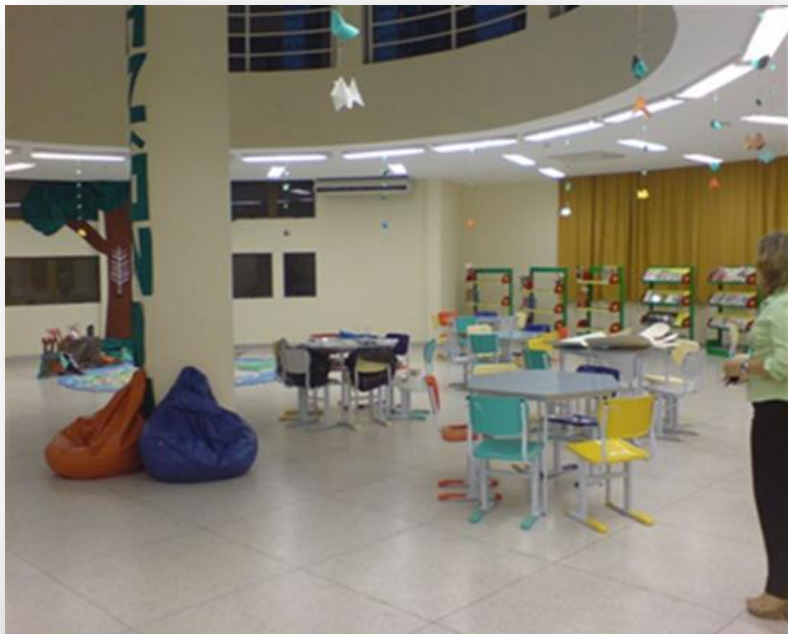
Colégio de Patamares - Salvador