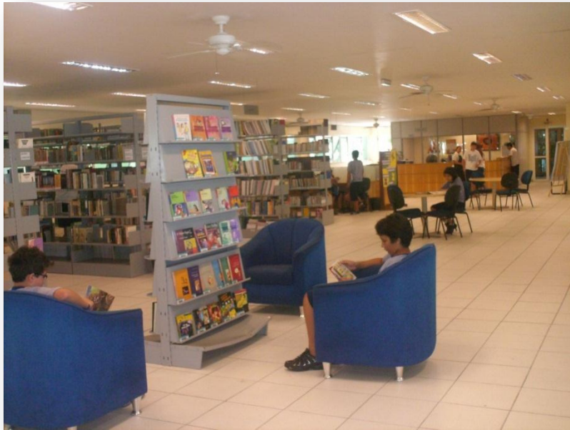
Colégio Marista de Vila Velha