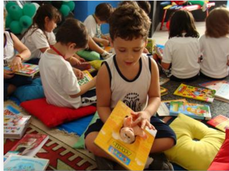
Colégio Marista de Natal - Northeast