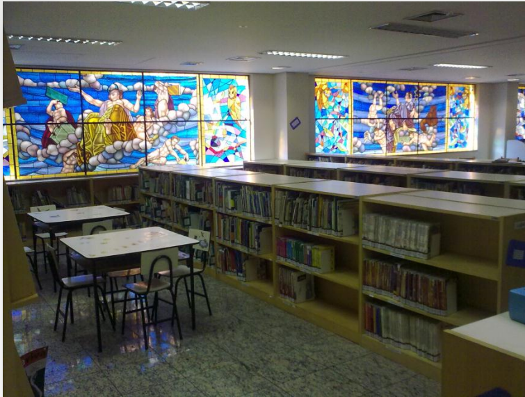
Colégio Marista Belo Horizonte - Southeast